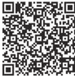
iOS Looking CAM